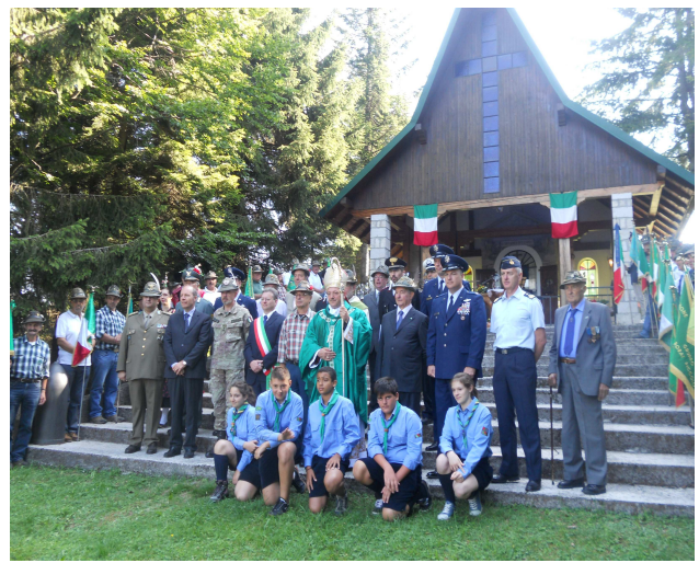
Consegna definitiva del XII Trofeo