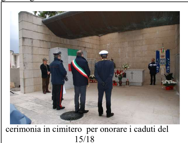
cerimonia in cimitero per onorare i caduti del 15/18

Alcune foto della giornata in cimitero in considerazione della commemorazione dei 100 anni della grande guerra.