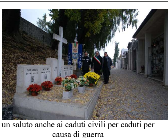
un saluto anche ai caduti civili per caduti per causa di guerra