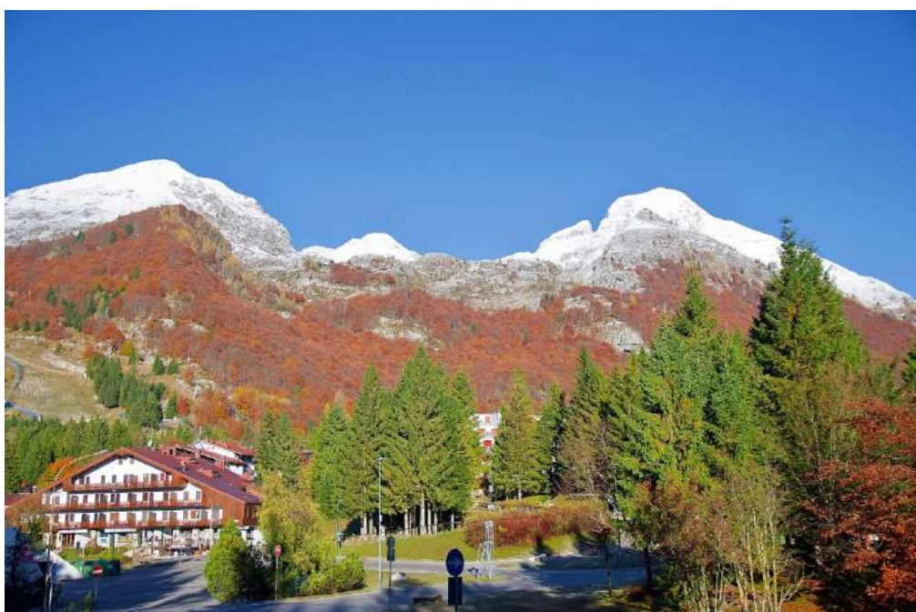
Foto di copertina con la prima neve stagionale.