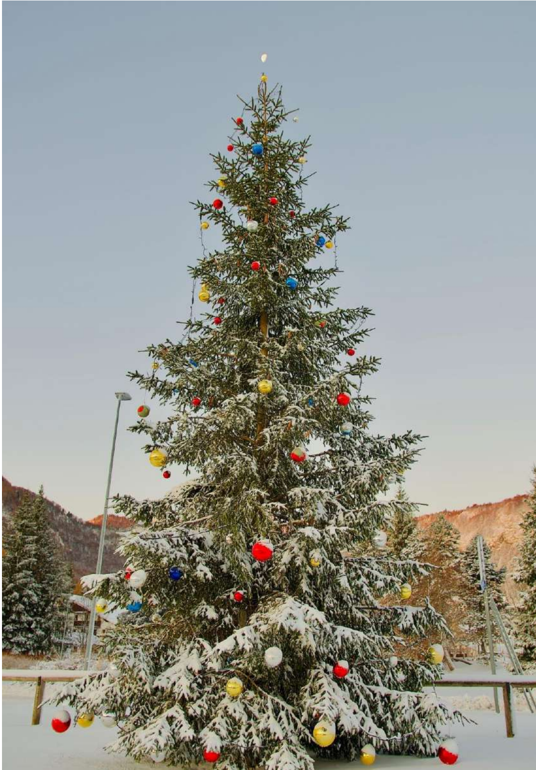
Buon Natale