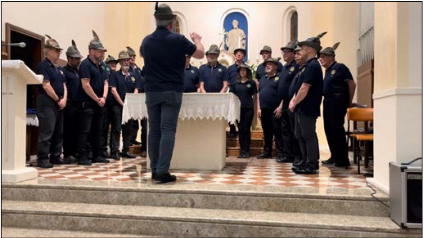
Sopra: Il Coro ANA Aviano si esibisce a Debba (VI) per la 95° Adunata degli Alpini Italiani