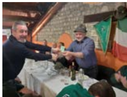
A lato e sotto: collage di foto della cena conviviale.