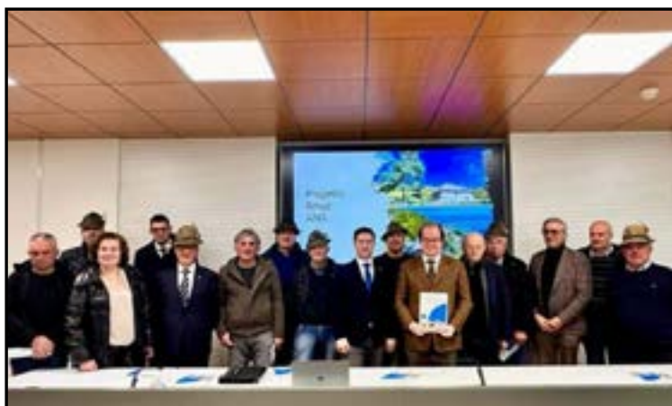
A sinistra: le autorità convenute per la conferenza stampa.

L'importo destinato alla nostra Baita è di 30.000 euro, il CG Nevio si è già attivato con imprese e professionisti locali, con l'obiettivo di iniziare il lavoro principale entro il nostro raduno delle penne nere di agosto. Assegnando direttamente agli Alpini questa attività di recupero è un segno di profonda gratitudine e fiducia per l'infaticabile impegno a servizio della comunità da parte della Regione.