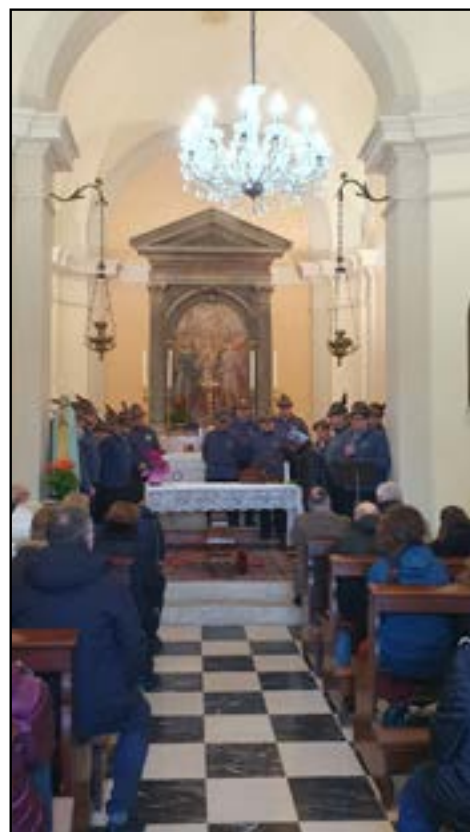
A destra: la bellissima chiesa di Pedemonte dedicata ai Santi Martiri Concordiensi ospita la Messa delle Penne Mozze 2024