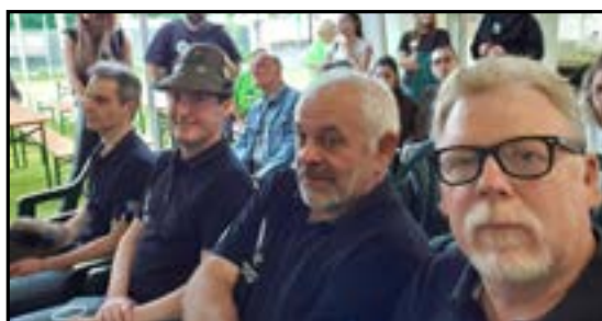
Tutto intorno: alcuni documenti informativi relativi all'evento e la documentazione della partecipazione del nostro gruppo con servizio di cucina.