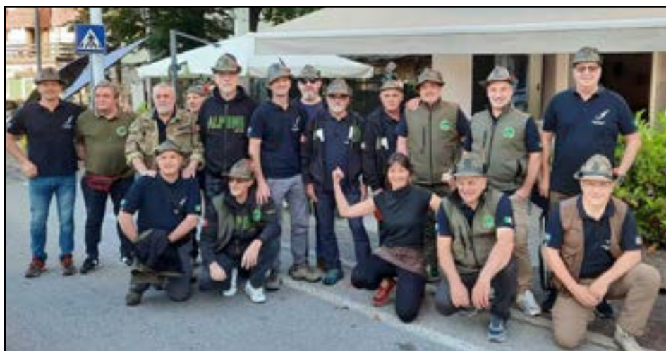
Sopra: Locandina dell'Adunata di Vicenza e rappresentativa del Gruppo C. Battisti in sfilata e presso le vie della città.