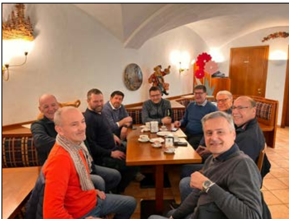
Sopra: sotto le volte del Bar Sport ha luogo un'intensa sessione di prove dell'anima più goliardica del coro.