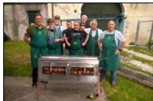
Sopra: ottima adesione all'evento da parte di associati, amici e familiari. La Brigata Cucine al completo.